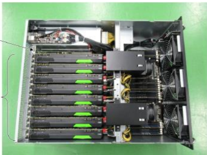
Ilustração do console do aparelho, contendo a UNIDADE DE PROCESSAMENTO DE DADOS PX74-14340*B 1:

1 -Ilustração do item - UNIDADE DE PROCESSAMENTO DE DADOS PX74-14340*B 1